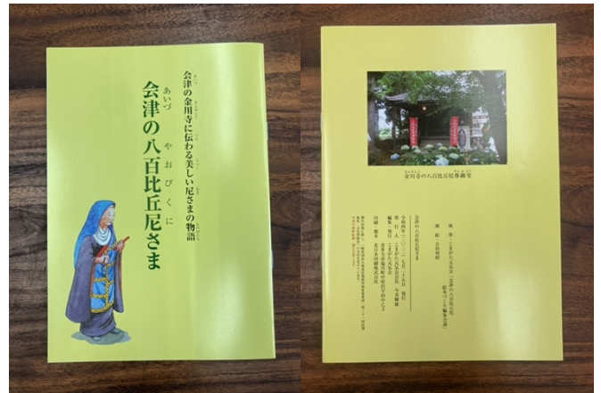
完成した本のオモテ表紙とウラ表紙

挿絵 吉田利昭さん（月刊タウン情報誌「会津嶺」編集者） 編集 遠藤由美子さん（奥会津書房代表） 小澤弘道さん（元喜多方市文化課長） 小熊千代一さん（元福島県立高等学校教員） 芳賀英一さん（元福島県文化振興財団歴史資料課長） 大西和榮さん（元元気会世話人）