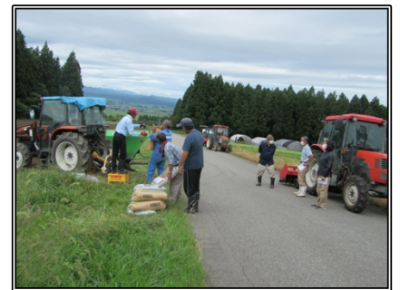
種まき作業準備の様子