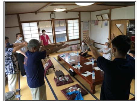
お試しサロンの様子

今後の設置希望があれば、社会福祉協議会の担当者に気軽に相談に乗っていただけますので事務局へ御連絡ください。