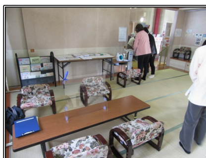
サポートチームの相談コーナー