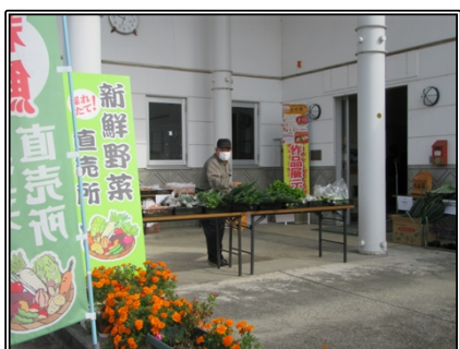
元気マルシェの販売

駒形地区文化祭が10月22日（土）23日（日）に開催され、こまがた元気会関係では、22日（土）に、こまがた元気マルシェの出店や、健康づくりサポートチームによる健康チェック・相談対応などを初めて実施し、好評をいただけたようです。