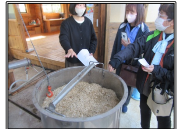
クロモジの木片から蒸留する様子

南会津町田島地区で、㈱一十八の経営する和精油（アロマオイル）精製工場を見学しました。地元で採取されるクロモジ（木です）から精油されるものは貴重品。軽トラ1台≒100kgから約コップ1杯の抽出。森林資源を活用する取組です。