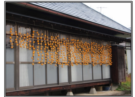
11月3日（金）に皮むき・吊るした干し柿（約550個）の様子