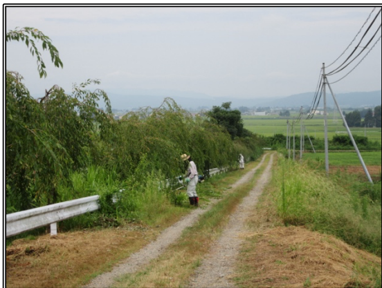
桜並木の下草刈り（8月25日）

この桜並木と道路向かい側にはヒガンバナが植栽され、花で彩る里づくり部会と雄国山麓ゆめクラブのメンバーが協力しなら手入れを行っています。