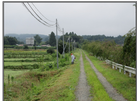
ヒガンバナ植栽地の草刈り（9月3日）