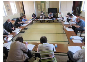
企画を検討する会議(5/19)