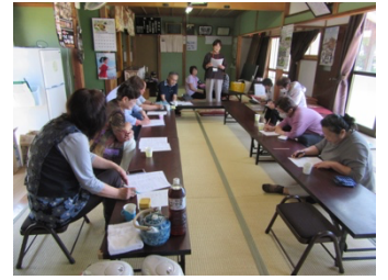
深沢サロンでのサポートチームの活動(5/17)